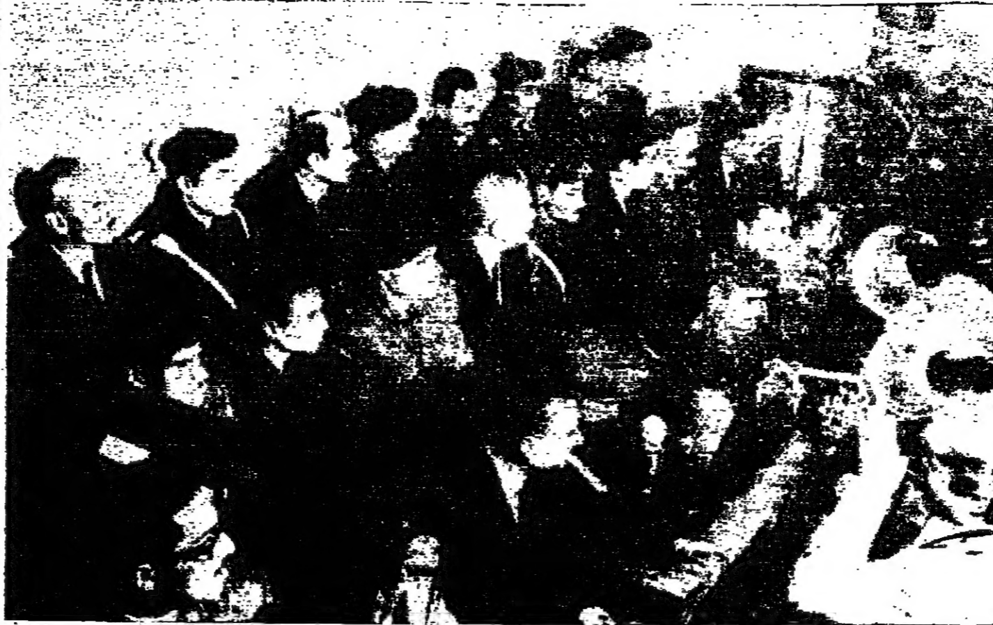
صورة للمحادثات الجارية لاعداد من التمهيد في مؤامرة قلب نظام الحكم في الوحدة وهم في قصر التتو - (صورة للبريطانيين)